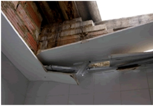
Figura 2. Estado de deterioración de la infraestructura de la vivienda de un niño víctima de violencia intrafamiliar en el barrio de San Juan de los Rios.