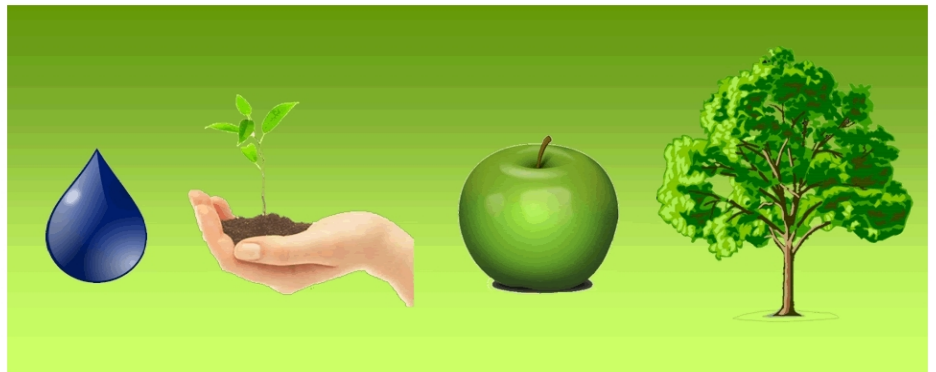
Figura 4. Diagrama que ilustra el ciclo de vida y el crecimiento, desde una gota de agua hasta un árbol maduro.